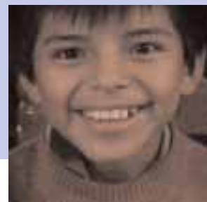
De izquierda a derecha: